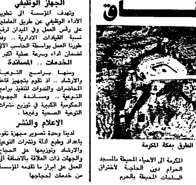
احد مشاريع الطرق بمكة المكرمة

عزيتي الام الرضاعة الطبيعية حق لطيف عليك ، فهي تعطى الطفل الناعة ضد الأمراض في الأشهر الأولى من عمره ، كما أنها تعينه على الامساك بالاسهل الذي يؤدي الى الجفاف والسمنة من أسباب الامساك بالاسهل الذي ينتشر بشكل واضح من حقه عليك في الرضاعة الطبيعية واحرصي عليها لأنها وسيلة لحماية من الامساك وما ينتج عنه من جفاف والتهيج والبرص